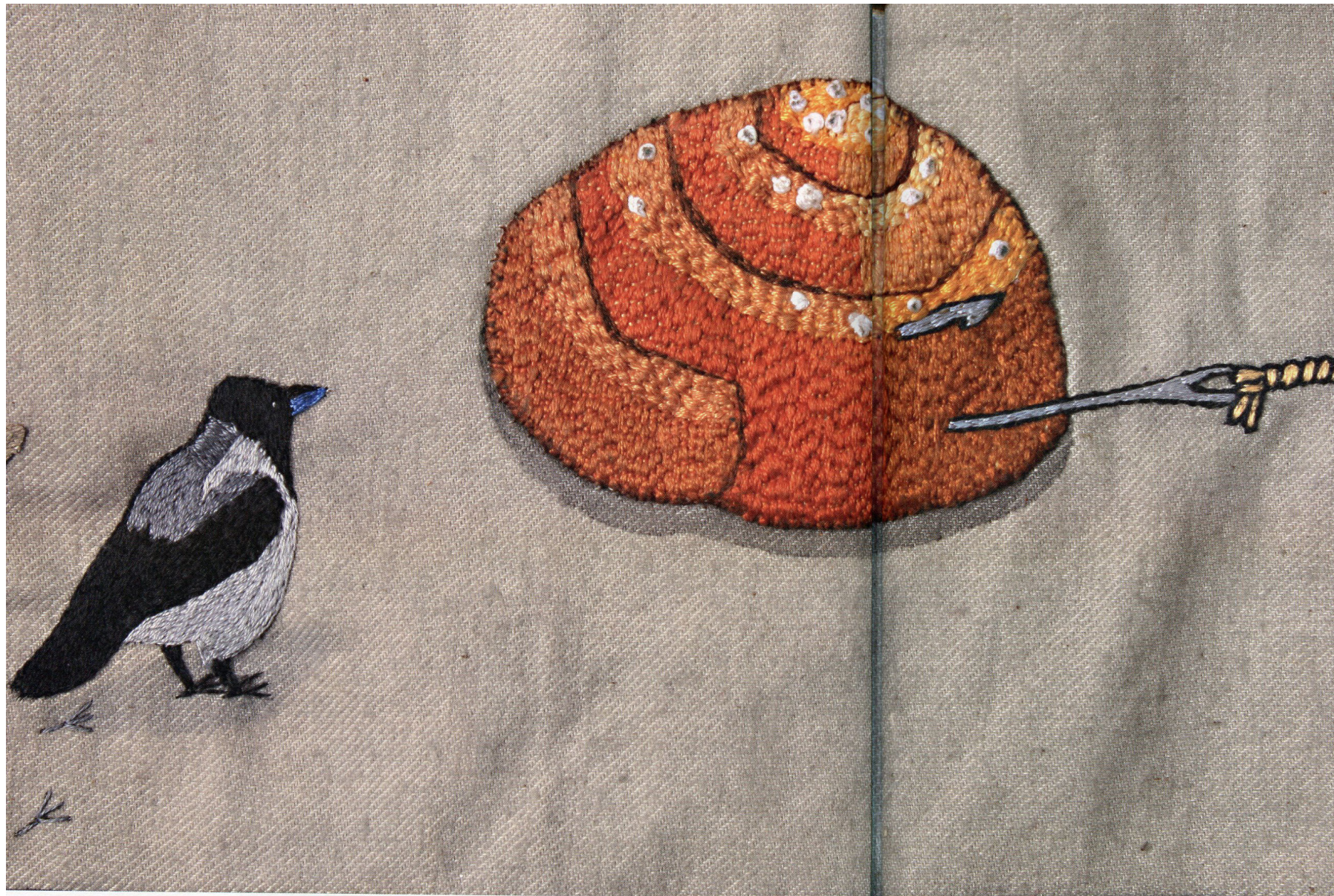
Detalj, se omslag för helheten.